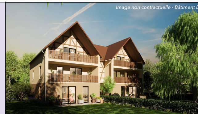
Image non contractuelle - Bâtiment D