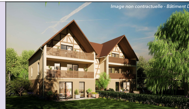
Image non contractuelle - Bâtiment D