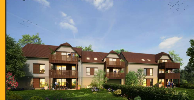
image non contractuelle - représentation des bâtiments G et F

Des modifications sont susceptibles d'être apportées à ce plan en fonction des nécessités techniques et administratives lors de la réalisation, pour les dimensions libres, positions des baies et des équipements électriques. Les surfaces données sont approximatives. Les retombées, soffites, faux plafonds, emplacements des équipements figurent à titre indicatif. Les surfaces habitables sont conformes au décret du 23 mars 1997 (Art.4.1).